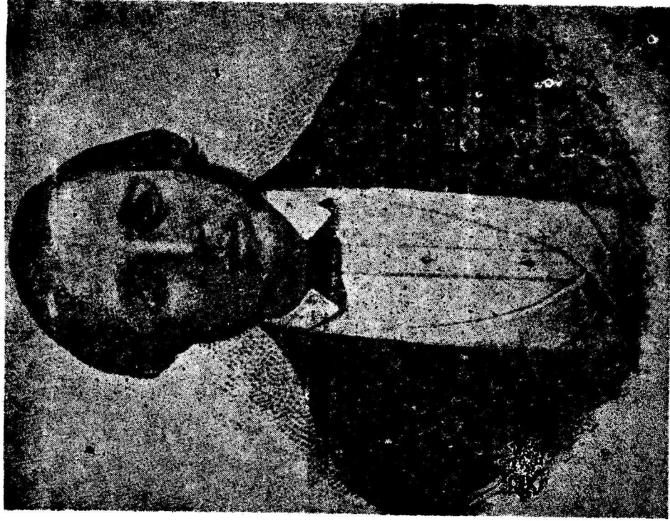
General Juan Zuazua, General de Generales