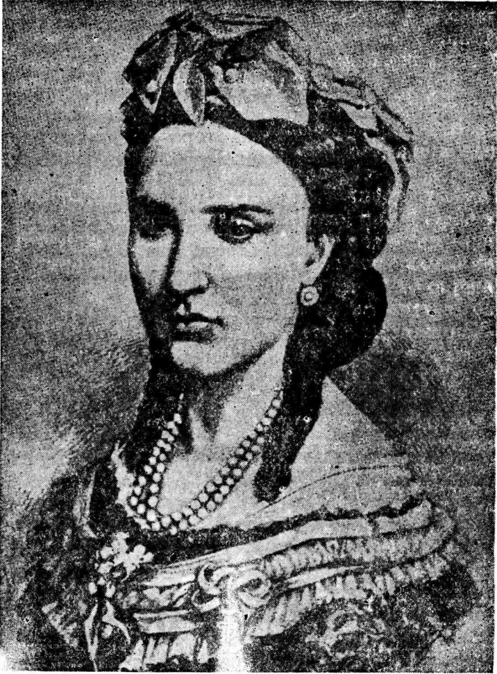
La Emperatriz Carlota Amelia